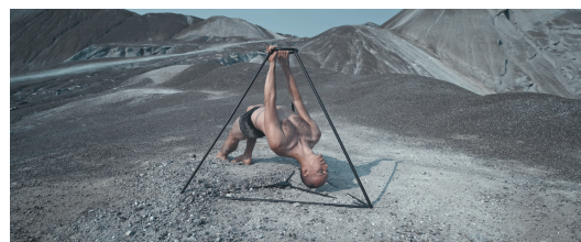
SAINT-RÉMI de Simon Vermeulen Canada | 2024 | 4 min