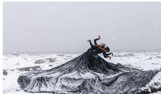
MARÉE NOIRE de Chantal Caron Canada | 2024 | 12 min