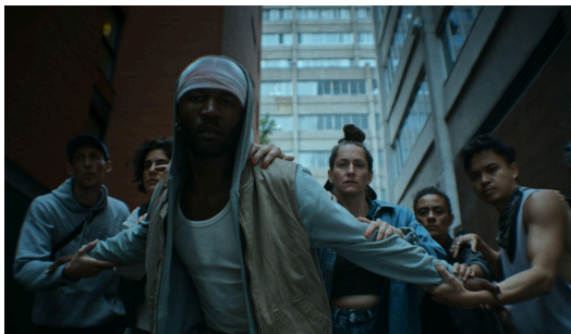
À BRAS-LE-CORPS de Chélanie Beaudin-Quintin Canada | 2024 | 14 min