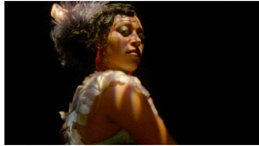
PIDIKWE de Caroline Monnet Canada | 2024 | 10 min